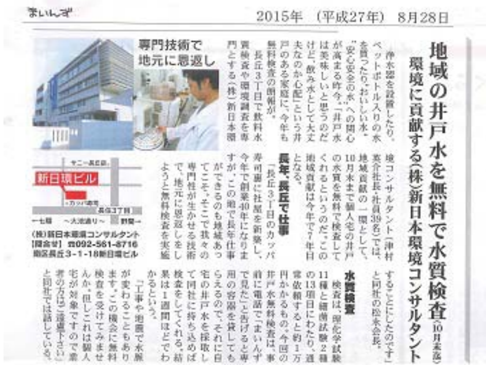
写真 5 井戸水の無料検査の募集

当社は水質分析を業務の一部としていることから、地域の井戸水の無料検査を環境活動として毎年実施しています。2015 年 8 月 28 日に地域のコミュニティ紙「まいんず」（写真 5）で無料検査の募集を行ったところ、59 件の依頼がありました。実施後、依頼者からお礼の手紙を頂くなど、地域との繋がりができると共に当社の PR ともなり、たいへん大きな効果があったと考えています。