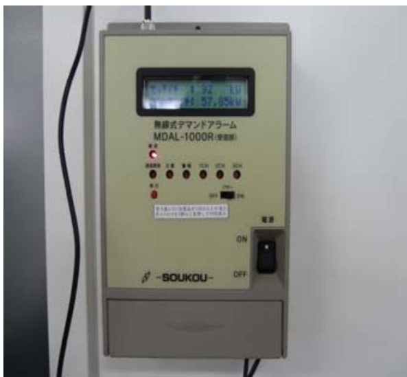
写真1 電力デマンド監視装置

本年度の購入電力量は目標値よりも 1.5%増となり、目標を達成することができませんでした。原因は大型機器を新たに導入したことによるものと考えていますが、可能な限り節電に努めます。写真1に示す電力デマンド監視装置を導入し、最大使用電力量を低減させることにより、電力使用量を削減する活動も実施しています。