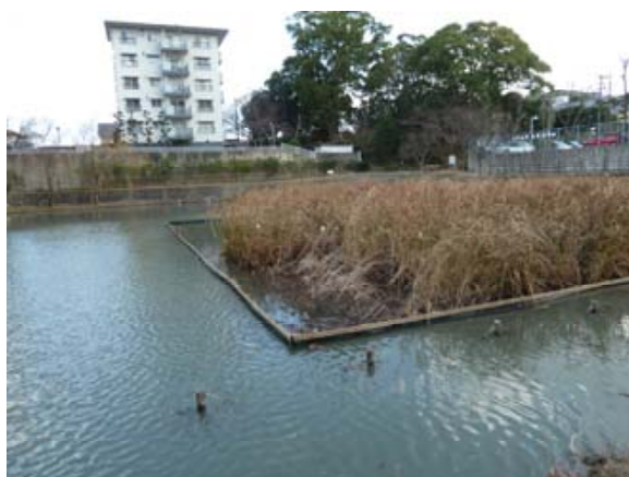
写真6 ツクシオオガヤツリ (福岡市の保護状況、平尾新池)

ツクシオオガヤツリはカヤツリグサ科の湿地植物で、福岡県指定天然記念物、環境省レッドデータブック絶滅危惧種 IB 類に指定された植物です。福岡市の大濠公園に隣接する小さな池の群落が天然記念物に指定されています。ツクシオオガヤツリは中国の宗との貿易の際に博多に着いた荷物に種子がついてきたものだと言われています。この植物の保護を目的にして、福岡市内の池、沼での分布状況の調査を行っています。分布調査の中では、新たな繁茂池を発見するなど、有意義な活動を行っています。