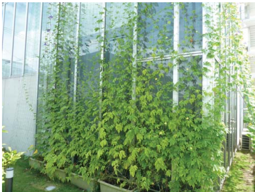
写真4 琉球アサガオとゴーヤによる壁面緑化

5月から9月の間、社屋の南側のガラス面に緑のカーテンとして、本年度は琉球アサガオとゴーヤを栽培し、社屋の緑化を実施しました（写真4）。琉球アサガオとゴーヤは壁面に沿って良く繁茂し、建物の遮光効果に役立ちました。次年度では、室温を測定するなどして、遮光効果を数値化することを試みます。