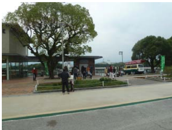
写真2 大濠公園の清掃風景

毎回、2名ずつの参加を目標としています。また、樋井川の環境活動では、地域の住民で組織している「樋井川を楽しむ会」が実施している清掃活動などに参加しています。