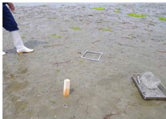
写真8 NPO の活動

九州の北部海域の底泥の浄化を課題に掲げて活動している NPO 法人に協力し、実験器材の貸出しやアドバイス等を行っています。浄化手法は光合成硫黄細菌を利用するもので、これまでに実施事例がなく、全く新しい方法として期待されています。