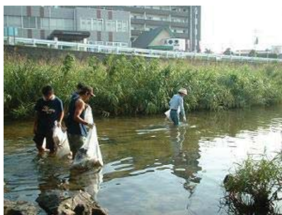
写真3 樋井川の活動風景